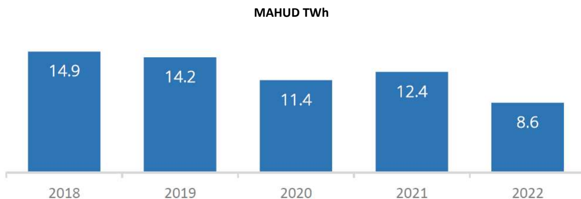
Joonis 2. Tarbijaile jaotatud maagaasi kogus aastatel 2018–2022 (TWh).

Gasu poolt tarbijaile tarnitud maagaasi kogus vähenes 2022. aastal 8,6 TWh-ni ehk 31% võrreldes 2021. aastaga. See tuleneb peamiselt maagaasi kõrgest hinnast, aga ka muudest teguritest – kõrgemast välistemperatuurist kütteperioodil, soojatootmise üleminekust muudele kütustele ja energiatõhususe meetmete rakendamisest.